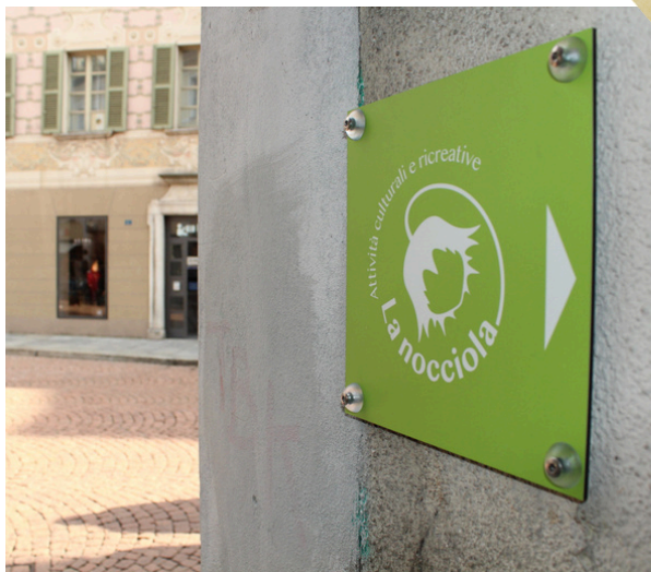
DA PIAZZA COLLEGIATA DIREZIONE LA NOCCIOLA