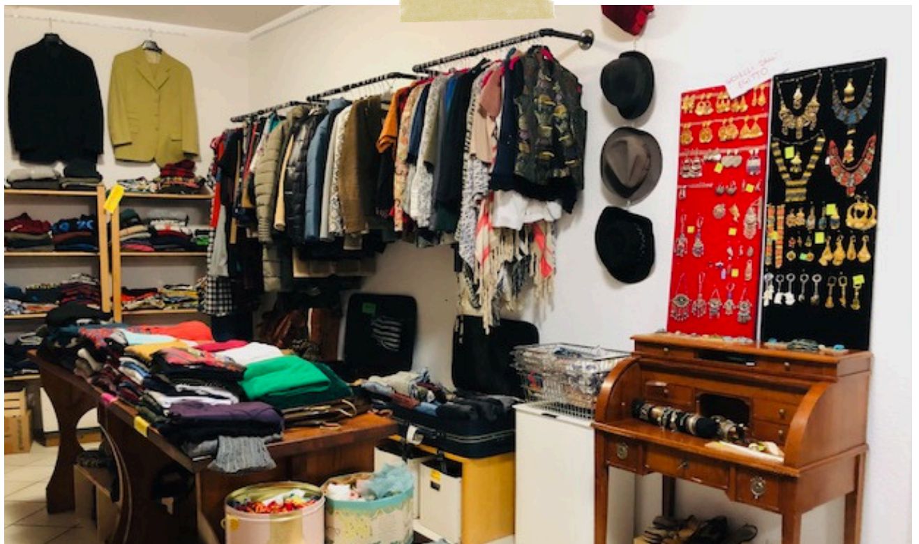
BOUTIQUE SLOW FASHION