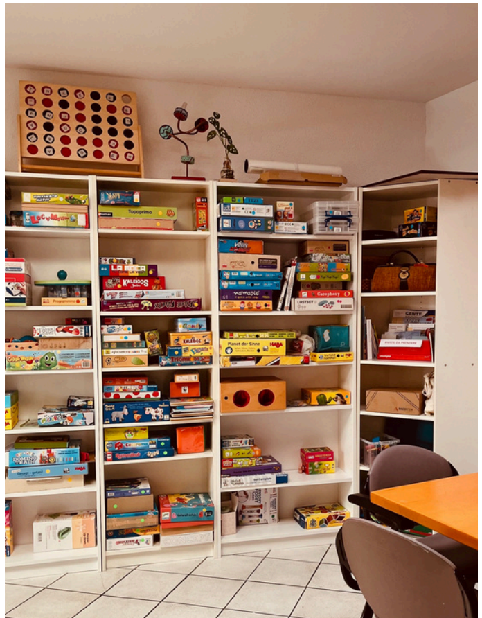
LUDOTECA SENZA ETÀ