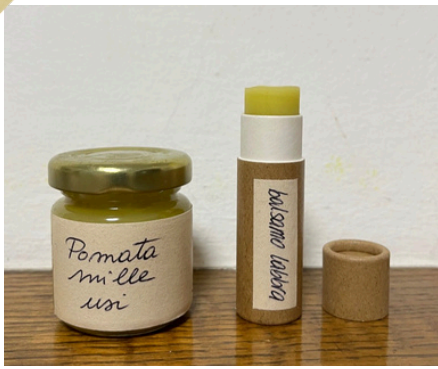
NEGOZIO IL SOGNO